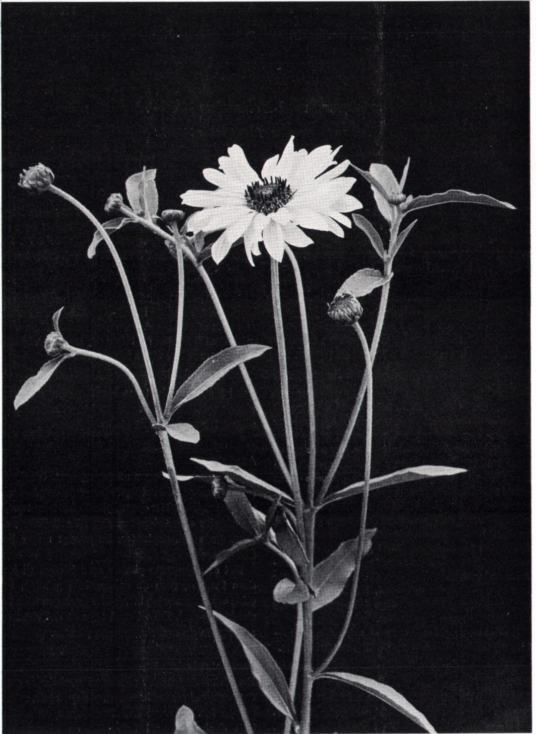
'Miss Mellish' S 72