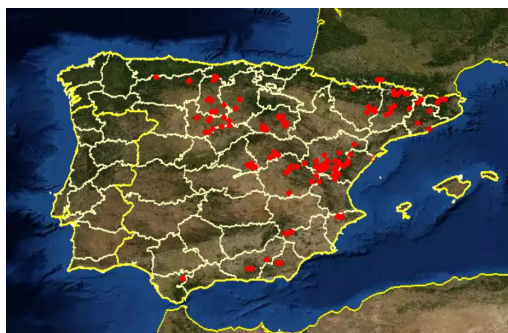
Àrea de distribució del HYSSOPUS OFFICINALIS a la península hispànica