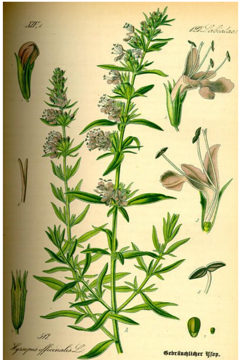
HYSSOPUS OFFICINALIS . Imatge de THOMÉ, OTTO WILHELM: Flora von Deutschland, Österreich und der Schweiz