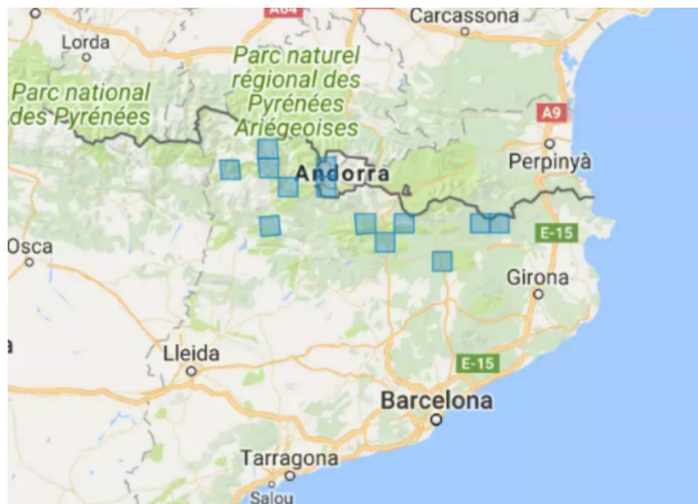
Àrea de distribució de al subespècie pilifer a Catalunya

[Banc de dades de biodiversitat de Catalunya]