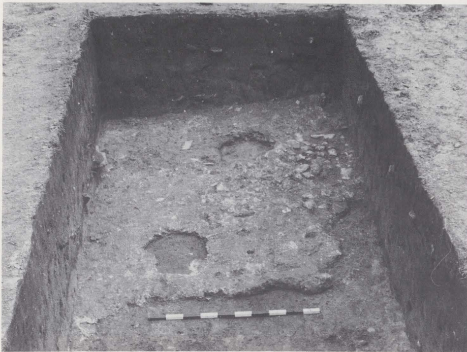
Fig. 64. Kalkmortelvloer van 2de aanbouw met paalgaten.

Op de mote, die ophoping F eigenlijk is, vonden we net als vorig jaar geen gebouwsporen terug. Herinneren we er nog aan dat deze mote doorsneden wordt door de XIIIde-eeuwse burcht waarvan we ook thans resten vrijlegden. Zo rust de fundering van een boogkolom van de weergang (fig. 63,5) op de puinsleuf van vertrek II. Het muurtje (fig. 63,6) dat erover gebouwd werd, dateert van heel wat recentere tijd.