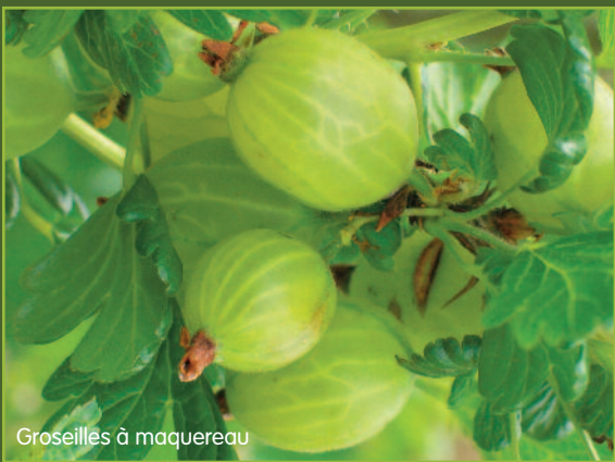
Groseilles à maquereau

Leur nom provient du fait que jadis, en Hollande et au Royaume-Uni, on servait les groseilles en accompagnement de ce poisson, un peu gras, afin d'en faciliter la digestion. Ces vigoureux arbustes souvent épineux portent des fruits solitaires, de 2 à 4 cm de diamètre, de couleur vert rougeâtre. Contrairement aux cassis et groseilles, ils se multiplient mieux par marcottage. Évitez de les planter en plein soleil, car ils sont sensibles à la sécheresse. Taillez les bois de plus de 4 ou 5 ans. La plupart des variétés présentées dans le jardin sont résistantes à l'oïdium.