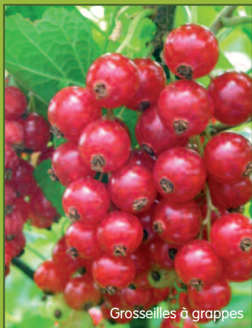
Groseilles à grappes