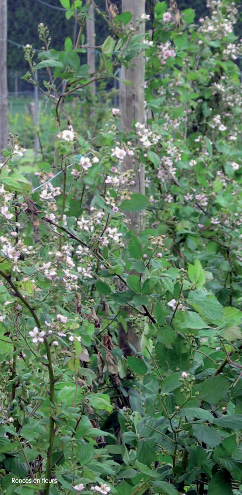
Ronces en fleurs