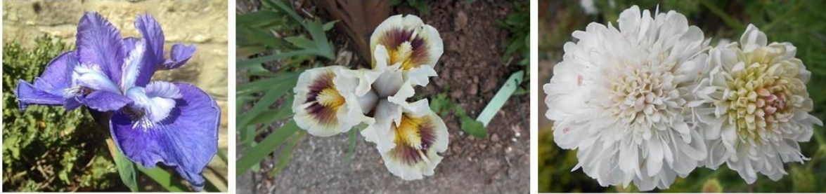
Iris 'Glanusk' and 'Muggles' and Knautia arvensis 'Rachael'