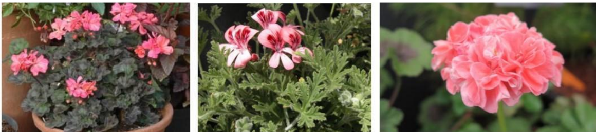
Pelargonium 'Paul West', 'Roller's Satinique' and 'Pink Raspail'