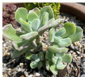
Chrysanthemum 'Tickle Pink' and 'Romantica' and Echeveria 'Frosty'