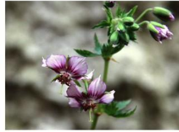
Hebe laevodiana , Hydrangea 'Trebah Silver' and Geranium 'David Bromley'