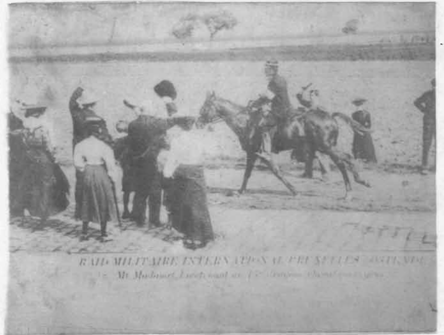
RAID MILITAIRE, EXTERIEUR DES ALPHES ET DES ALPES Au Maroc, le 1er mai 1917. (L'Algerien, 1917)