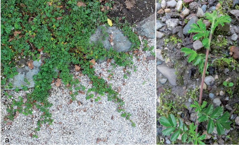
Abb. 1: Acaena novae-zelandiae bildet dichte Matten aus langen Kriechtrieben, die auch vor Beetbegrenzungen nicht Halt machen (a). Die Blätter sind unpaarig gefiedert (b).

1999) und dienen der Kalibrierung des Molekularen Stammbaums (XIANG et al. 2016). Die letzte Monographie der Gattung ist aber recht alt (BITTER 1911), und zwischenzeitlich wurden viele Umkombinationen oder neue Abgrenzungen von Sippen durchgeführt (HASSLER 2019) bzw. Kultursorten gezüchtet. Erschwerend kommt hinzu, dass A. novae-zelandiae im natürlichen Verbreitungsgebiet in Australien und Neuseeland Hybriden mit anderen Acaena -Arten bildet (SYMON et al. 2000). Eine Neubearbeitung ist daher dringend nötig. Die Beschreibung von Acaena novae-zelandiae basiert auf HARDEN & RODD (1990), MACMILLAN (2014) und SELL & MURRELL (2014).