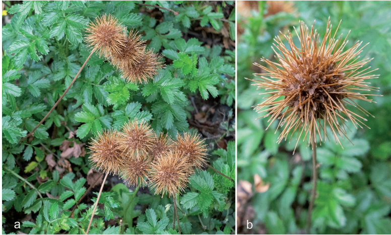
Abb. 3: An den einzelnen Früchten sitzen jeweils vier lange Fortsätze mit Widerhaken an der Spitze (b). Die kugeligen Fruchtstände (burr) bestehen aus mehreren Dutzend Früchten und verhaken sich zu übergeordneten Einheiten (a).

an der Oberseite kahl und besitzen an der Unterseite anliegende Haare. Die oberen Fiedern sind die größten und erreichen eine Länge von (5–)8–12(–19) mm und eine Breite von 3–6(–10) mm. Die Stipeln bilden an der Basis eine Scheide. An den Kriechtrieben entspringen 5–10 cm lange, aufrechte Blühtriebe mit apikalen, kugeligen Infloreszenzen mit einem Durchmesser von 6–10 mm (Abb. 2a und 2b) und 80–100 Blüten. Die Blühtriebe verlängern sich zur Fruchtreife auf bis zu 20 cm. Die sitzenden Blüten sind klein und besitzen ein tubuläres Hypanthium. Normalerweise sind vier Sepalen ausgebildet (Abb. 2b). Petalen fehlen, die Zahl der Staubblätter beträgt 2 (selten 3). Die Blütezeit in Klagenfurt (sowie in Großbritannien und Nordamerika) liegt zwischen Mai und Juni, wobei es interessanterweise für den Edinburgh Botanic Garden eine historische Angabe für Dezember gibt (BALFOUR 1863–64). Fruchtblätter sind einzeln und bilden als Frucht eine Achäne, die im Hypanthium eingeschlossen bleibt. Dieser Fruchttyp wird als Dicesium bezeichnet (SPJUT 1994). Das Hypanthium bildet vier Stacheln aus, die an den Spitzen Widerhaken besitzen (LEE et al. 2001) und bis 10 mm lang sind (Abb. 3b). Eine Vielzahl an einzelnen Früchten steht in einem runden Fruchtstand (Köpfchen) und bildet kugelige „Kletten“ (burr) mit einem Durchmesser von 20–25(–35) mm (Abb. 3a und 3b). Diese können sich miteinander verhaken und so größere Aggregate bilden.