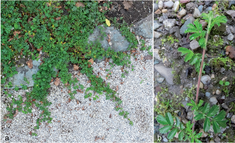
Abb. 1: Acaena novae-zelandiae bildet dichte Matten aus langen Kriechtrieben, die auch vor Beetbegrenzungen nicht Halt machen (a). Die Blätter sind unpaarig gefiedert (b).

1999) und dienen der Kalibrierung des Molekularen Stammbaums (XIANG et al. 2016). Die letzte Monographie der Gattung ist aber recht alt (BITTER 1911), und zwischenzeitlich wurden viele Umkombinationen oder neue Abgrenzungen von Sippen durchgeführt (HASSLER 2019) bzw. Kultursorten gezüchtet. Erschwerend kommt hinzu, dass A. novae-zelandiae im natürlichen Verbreitungsgebiet in Australien und Neuseeland Hybriden mit anderen Acaena -Arten bildet (SYMON et al. 2000). Eine Neubearbeitung ist daher dringend nötig. Die Beschreibung von Acaena novae-zelandiae basiert auf HARDEN & RODD (1990), MACMILLAN (2014) und SELL & MURRELL (2014).